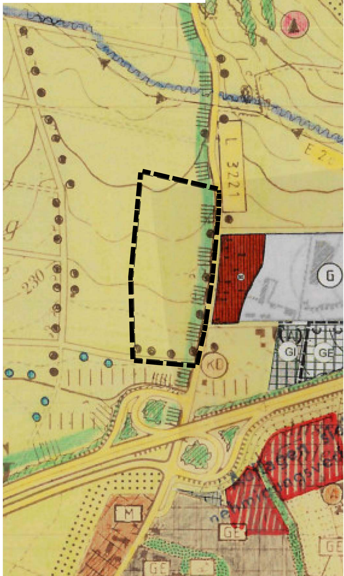
Vor der Änderung - M. 1/ 5.000