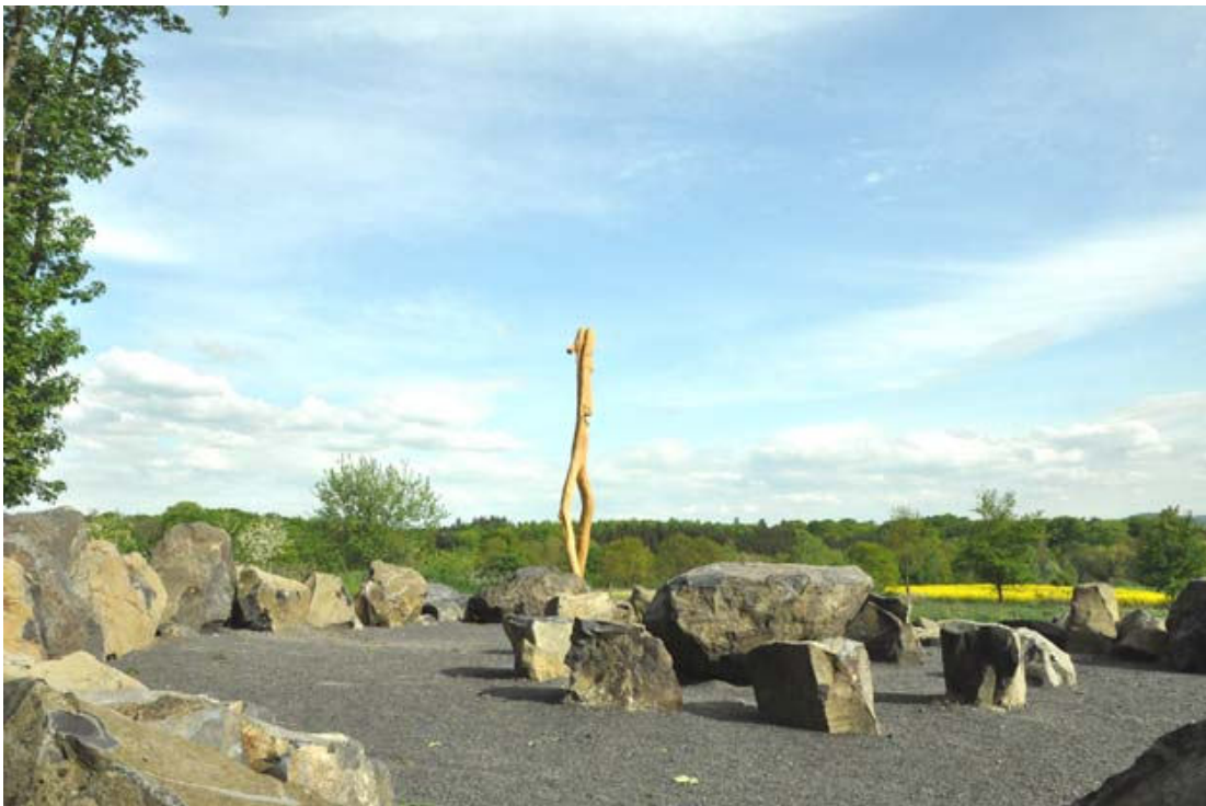
„Thing-Platz Mader Heide“