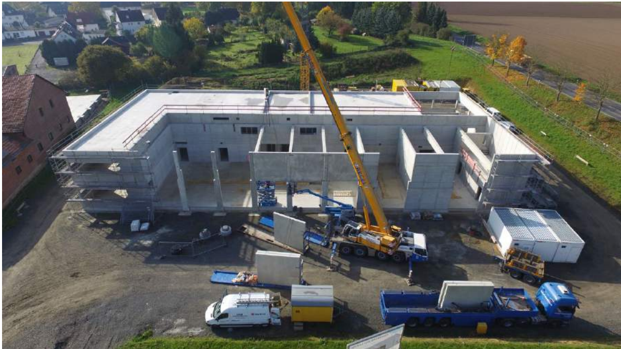
Neubau Feuerwehr Gudensberg