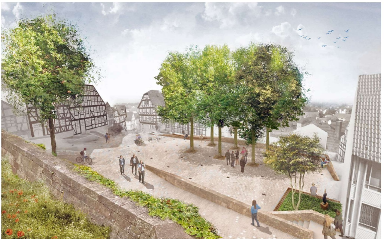
Entwurf Neugestaltung „Alter Markt“ Gudensberg (Grafik: Loma)